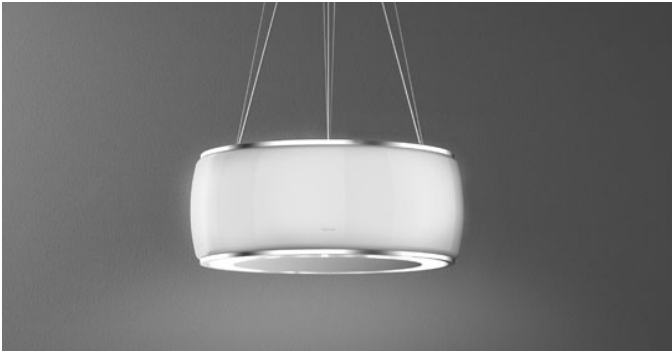
Das Bild dient rein einer groben Information. Es kann von der ausgewählten Version abweichen.