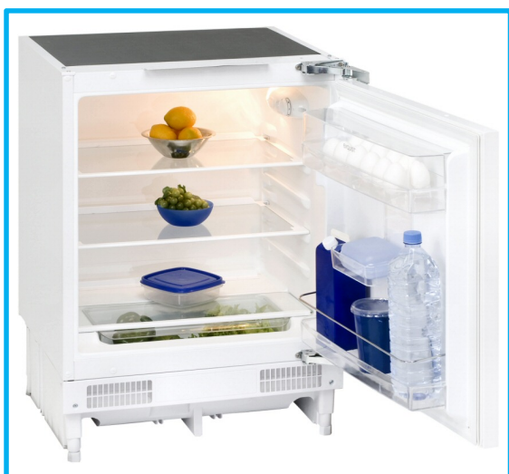
UKS 140-1 RVA+