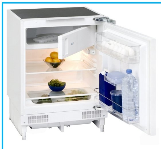
UKS 130-1 A+